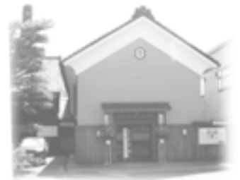
イベント蔵・夢空間